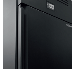
Su richiesta personalizzazione finitura colore