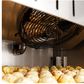
Evaporatori con trattamento in cataforesi e ventilatori elettronici