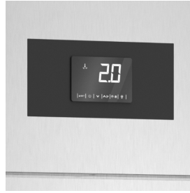
Monitoraggio costante della temperatura con scheda di controllo digitale