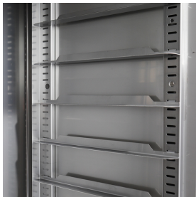
Cremagliere con guide facilmente rimovibili con 74 posizioni (passo mm 16,5)