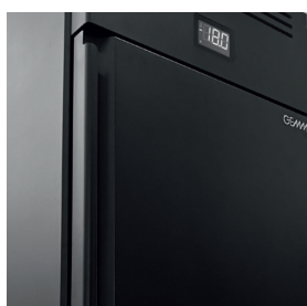
Su richiesta personalizzazione finitura colore