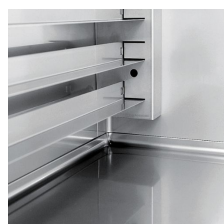
Cremagliere con guide facilmente rimovibili con 74 posizioni (passo mm 16,5)