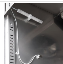
Controllo dell'umidità con sonda elettronica