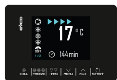
Scheda elettronica Touch 2,8" con visualizzazione Digit