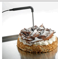
Sonda al cuore di serie