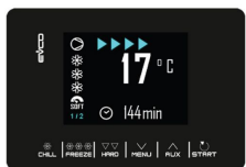
Scheda elettronica Touch 2,8" con visualizzazione Digit