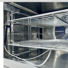
Dettaglio ventilazione interna