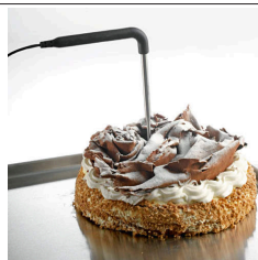
Sonda al cuore di serie