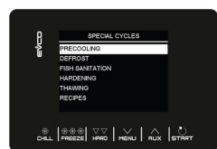
Cicli speciali preimpostati