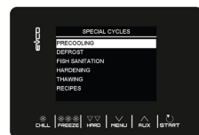
Cicli speciali preimpostati