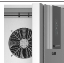
Costruzione in acciaio inox, con spessore isolamento di 60mm.