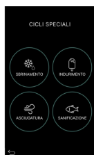
Schermata Cicli speciali