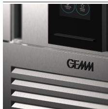
Particolare pannello areazione per una facile pulizia