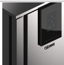
Interfaccia touch screen 7" interamente customizzata GEMM.