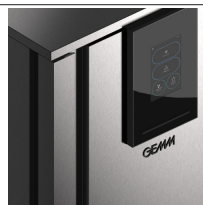
Interfaccia touch screen 7" interamente customizzata GEMM.