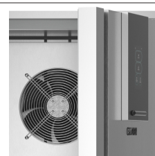
Costruzione in acciaio inox, con spessore isolamento di 60mm.