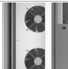
Controllo della ventilazione in tutte le fasi