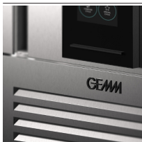
Particolare pannello areazione per una facile pulizia