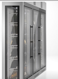
Fianchi in vetro (su richiesta)