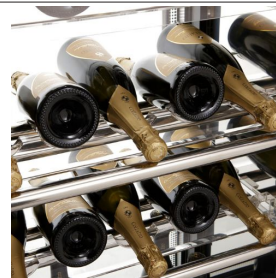
SC5/03 Struttura culle in plexiglass orizzontali